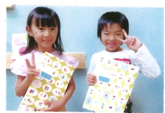
ごほうびに、それぞれが好きな絵本を園からプレゼントしました。